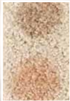
VORHER Rotwein /Fruchtsaft